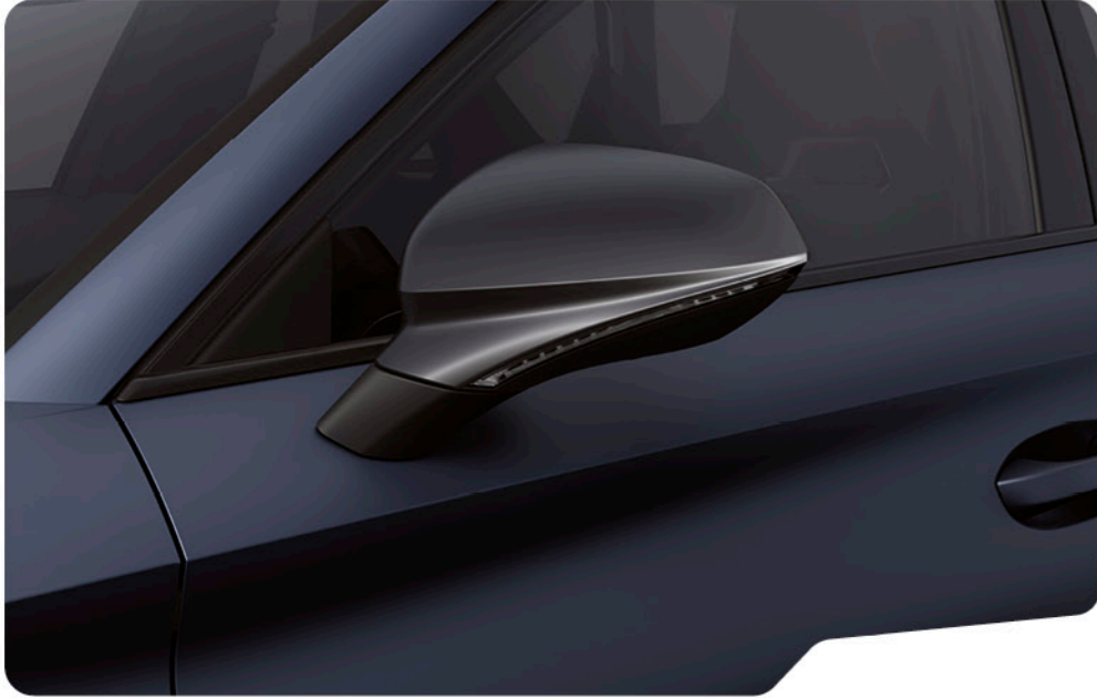
↓ BLEU PÉTROLE MAT