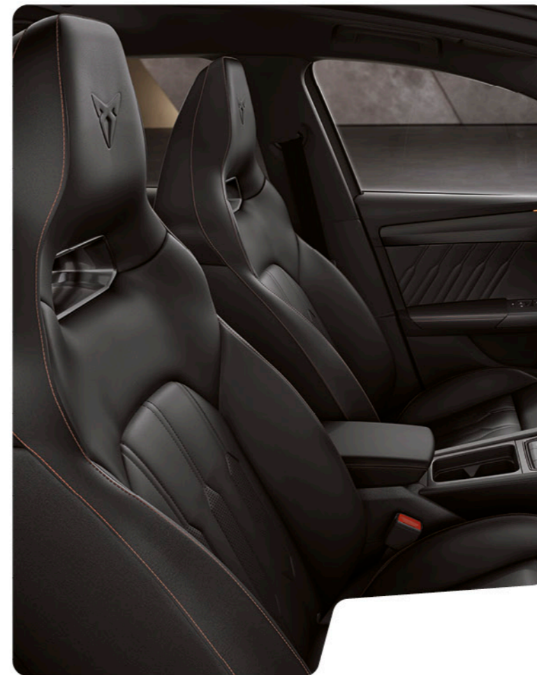
← SIÈGES BAQUETS CUIR NOIR AVEC SURPIQÛRES COPPER ET CONTRE-PORTES/PLANCHE DE BORD EN SIMILICUIR NOIR