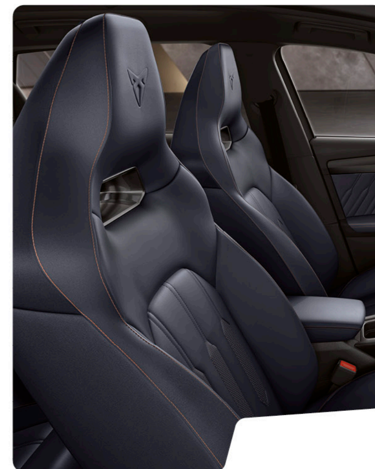
→ SIÈGES BAQUETS CUIR BLEU AVEC SURPIQÛRES COPPER ET CONTRE-PORTES/PLANCHE DE BORD EN SIMILICUIR BLEU