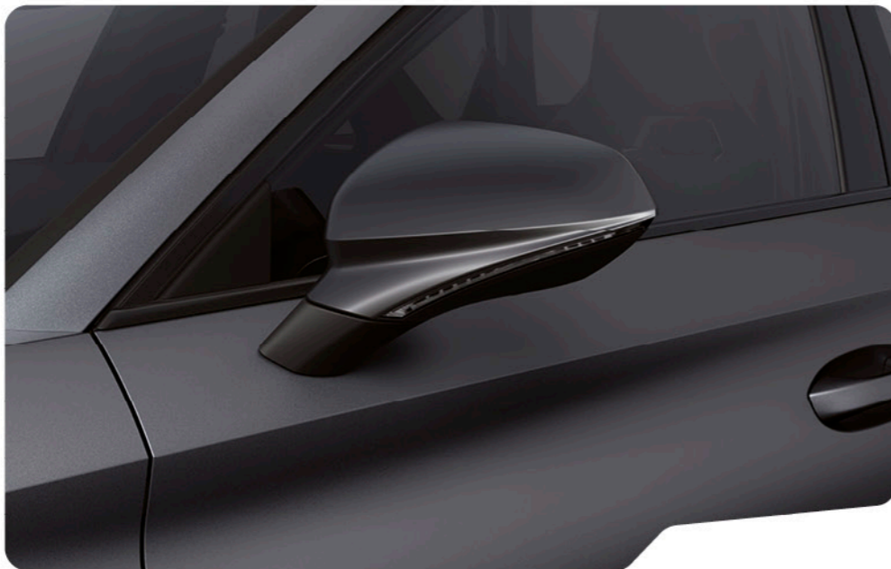
↓ GRIS MAGNÉTIQUE MAT