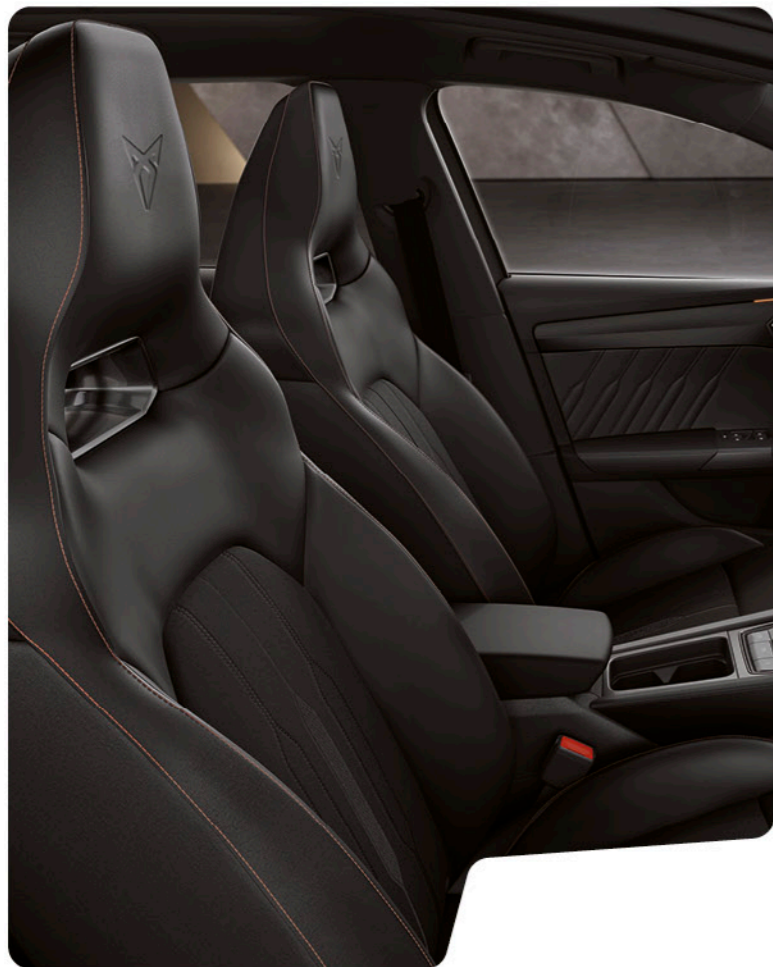
↑ SIÈGES BAQUETS TISSU NOIR / SIMILICUIR AVEC SURPIQÛRES COPPER